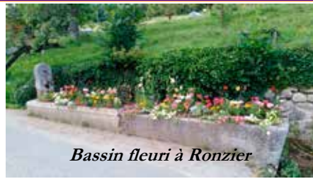
Bassin fleuri à Ronzier