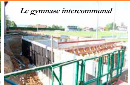
Le gymnase intercommunal