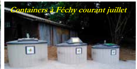
Containers à Féchy courant juillet

A l'heure où les cartables sentent encore le neuf et où les trousseaux ne sont pas encore tâchés, le service Enfance / Jeunesse vous a concocté une année remplie de beaux projets! L'équipe d'animation, va faire naître un compost dont vos enfants seront les premiers acteurs. Le projet jardin mis en place l'année dernière sera reconduit. Cette année les salades et pommes de terre récoltées ont ravi les papilles de vos enfants. Face au succès de la veillée « jeux m'amuse en famille » de juin dernier, le service Enfance / Jeunesse organisera une nouvelle soirée autour du jeu de société le mardi 19 novembre prochain.