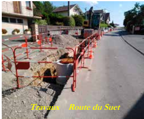
Travaux Route du Suet