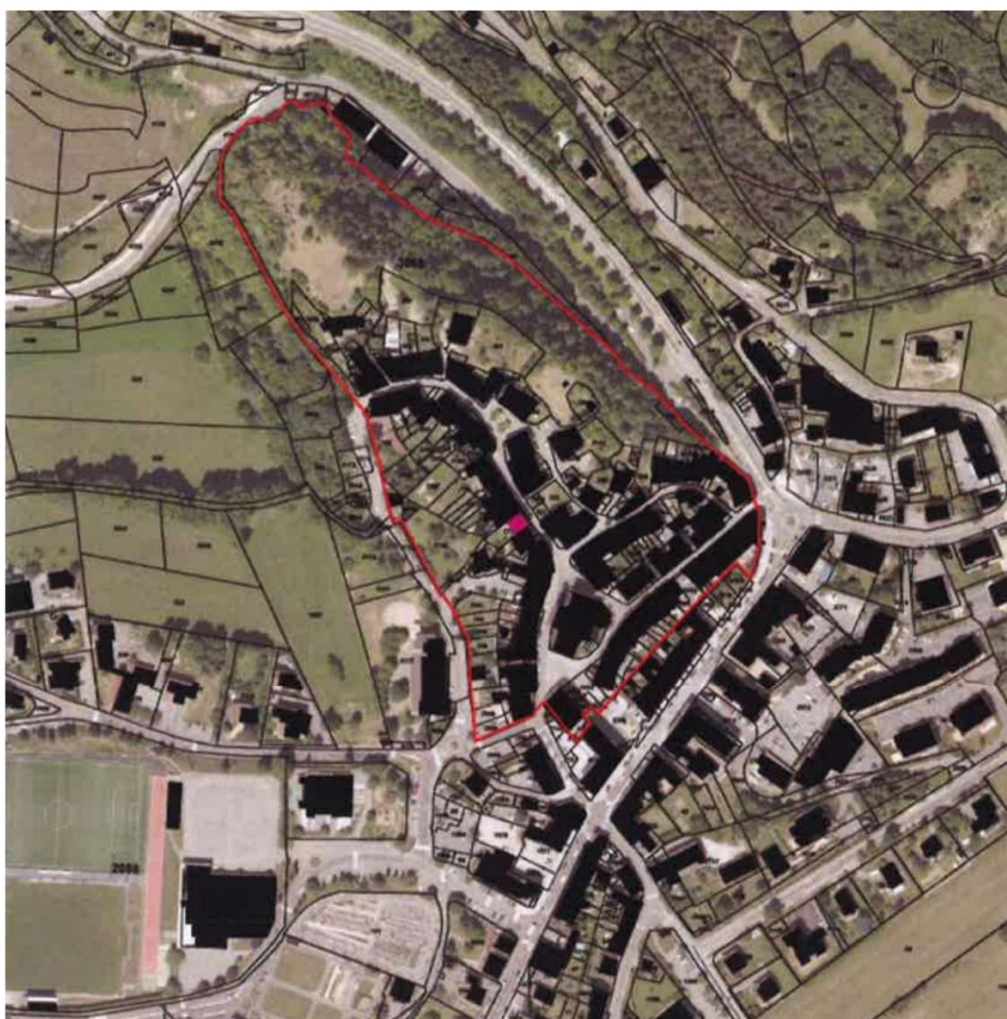
Nouveau périmètre délimité des abords (PDA) de la Maison Fésigny

Compte tenu de l'analyse du site et selon l'article L.621-30 du Code du Patrimoine, il est proposé de limiter le périmètre à l'ensemble urbain autour de la Maison Fésigny, compris entre l'ancien rempart à l'Ouest, avec ses jardins et la frange intermédiaire du coteau à l'Est. La limite sud se situera entre la mairie et l'église.