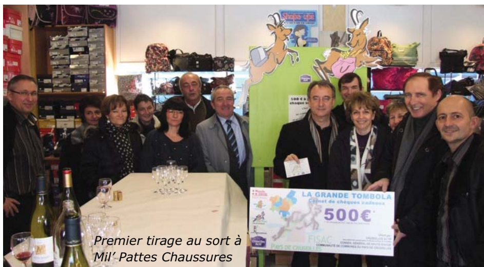
Premier tirage au sort à Mil' Pattes Chaussures