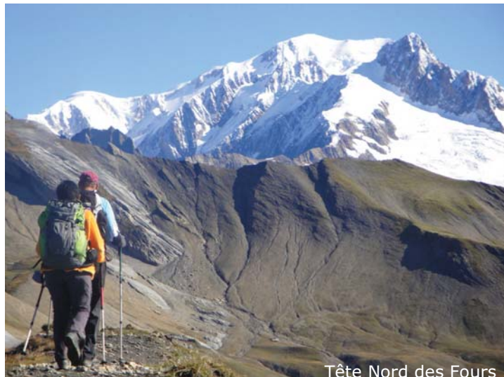
Tête Nord des Fours

« les amis de la Servette »); les suivantes furent des randonnées de 900 à 1200 m de dénivelée dans les massifs du Chablais, Jura, Bauges, Aiguilles rouges et Beaufortain.