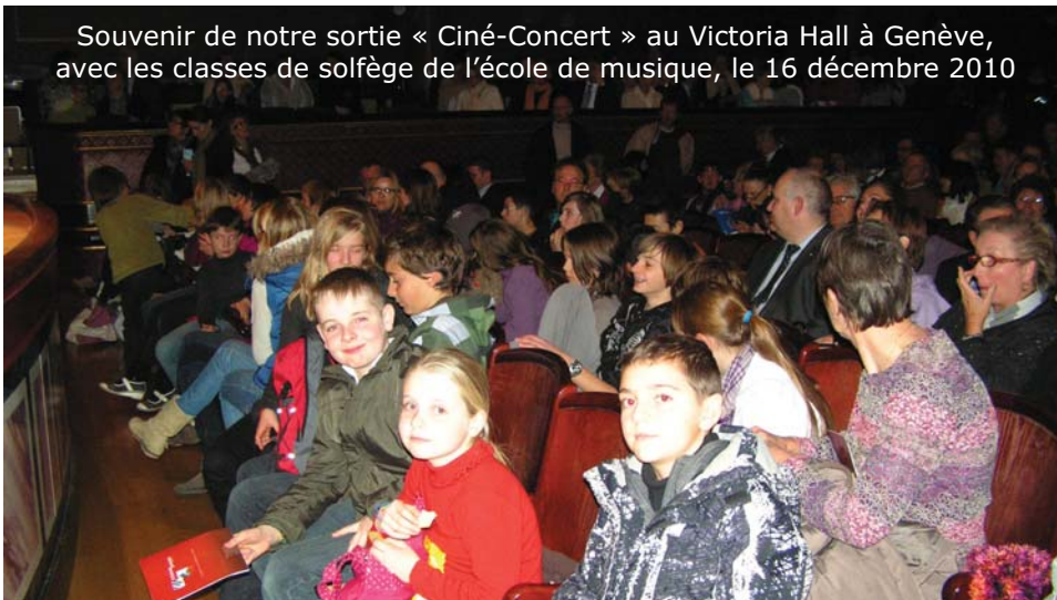
Souvenir de notre sortie « Ciné-Concert » au Victoria Hall à Genève, avec les classes de solfège de l'école de musique, le 16 décembre 2010

Alors venez nombreux pour partager ces bons moments musicaux afin de débiter au mieux cette nouvelle année.