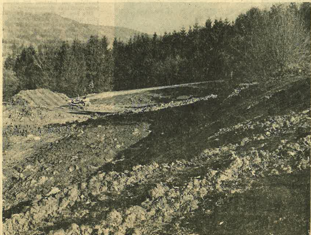
Ici sera construite la piscine