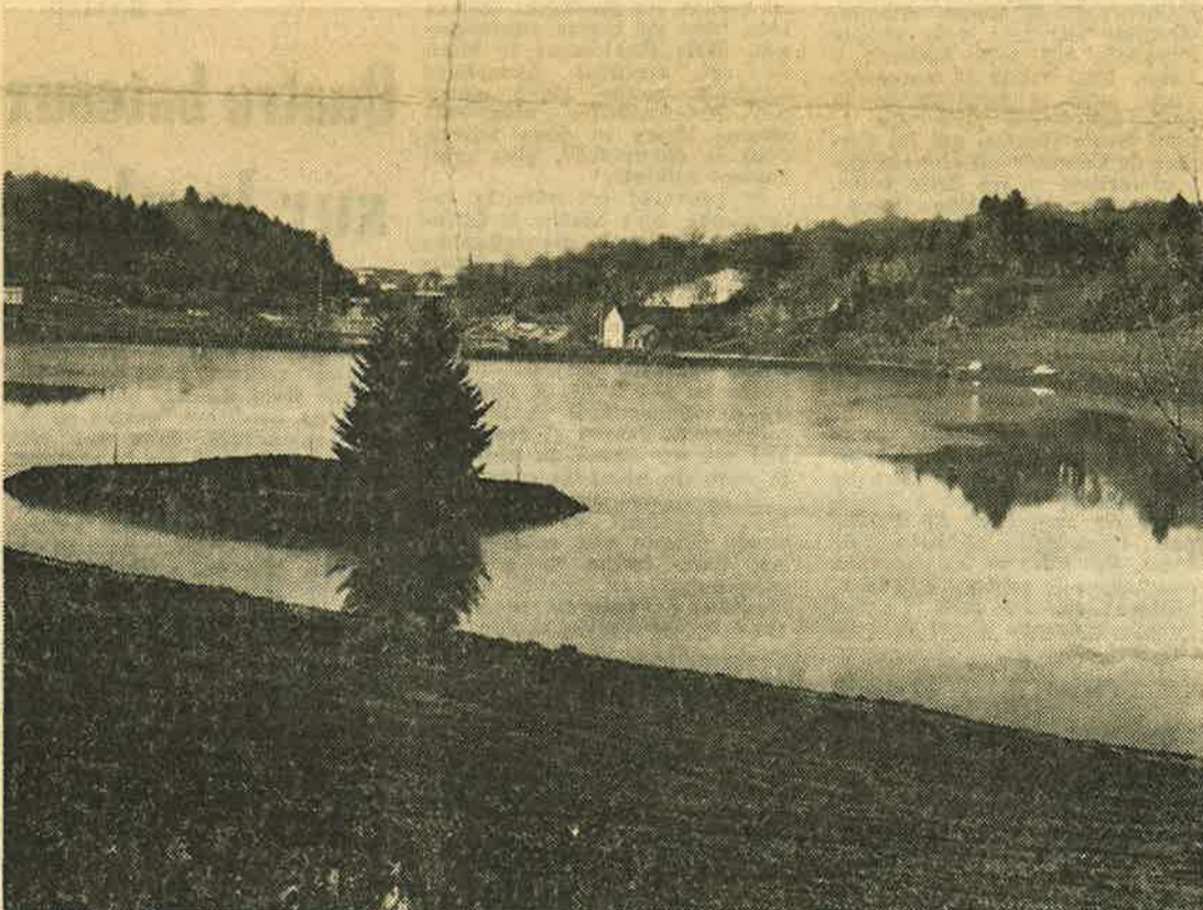
Le lac de Cruseilles (6 ha, profondeur maximum 8 m). Il a aussi son lot de cygnes